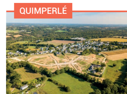
QUIMPERLÉ Stang An Aman 2 22 terrains de 372 à 571 m 2 À partir de 43 000 €