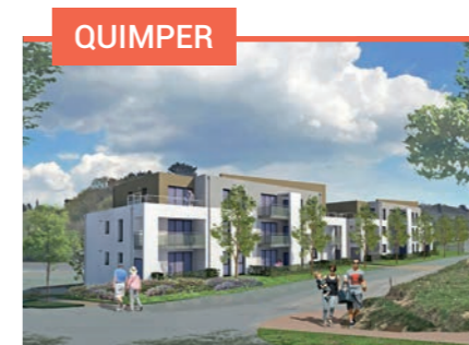
QUIMPER Les Terrasses du Vallon 28 appartements du T2 au T4 À partir de 115 300 €

Retrouvez l'ensemble de nos programmes de terrains et d'immobilier neuf sur