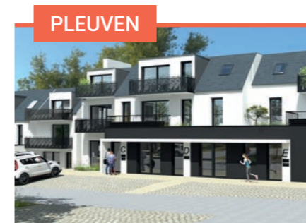
PLEUVEN Maner An Traon 22 appartements du T2 au T4 À partir de 137 610 €