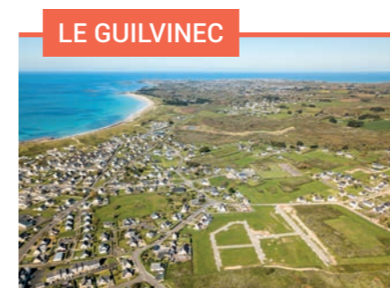
LE GUILVINEC Les Landes de Lanvar 26 terrains de 376 à 644 m 2 À partir de 45 000 €