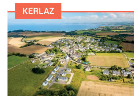
KERLAZ Le Clos Saint Germain 9 terrains de 311 à 546 m 2 À partir de 38 000 €